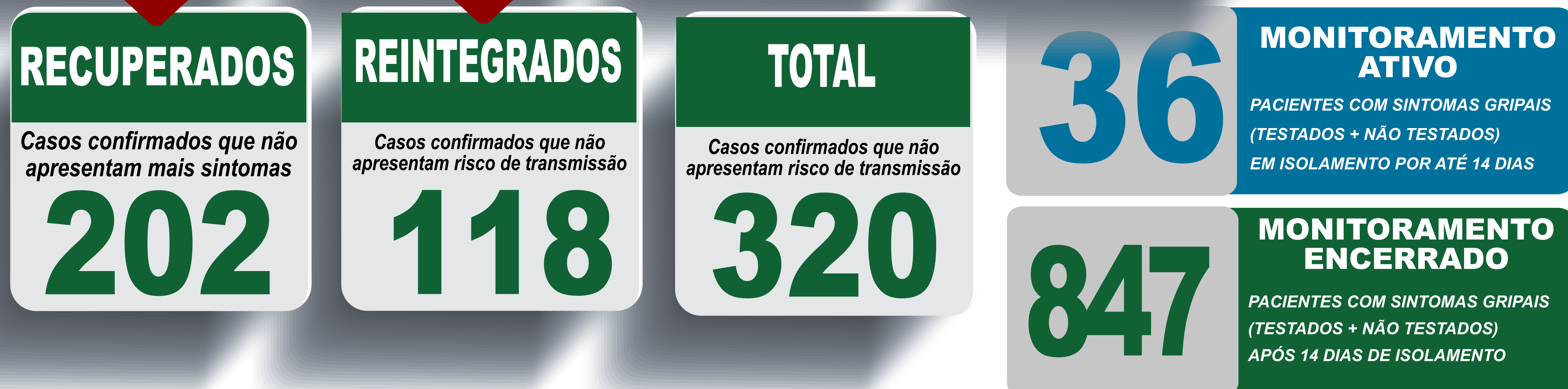
PLANILHA DE CASOS DE COVID-19 POR LOCAL DE RESIDENCIA, JABOTICATUBAS/MG