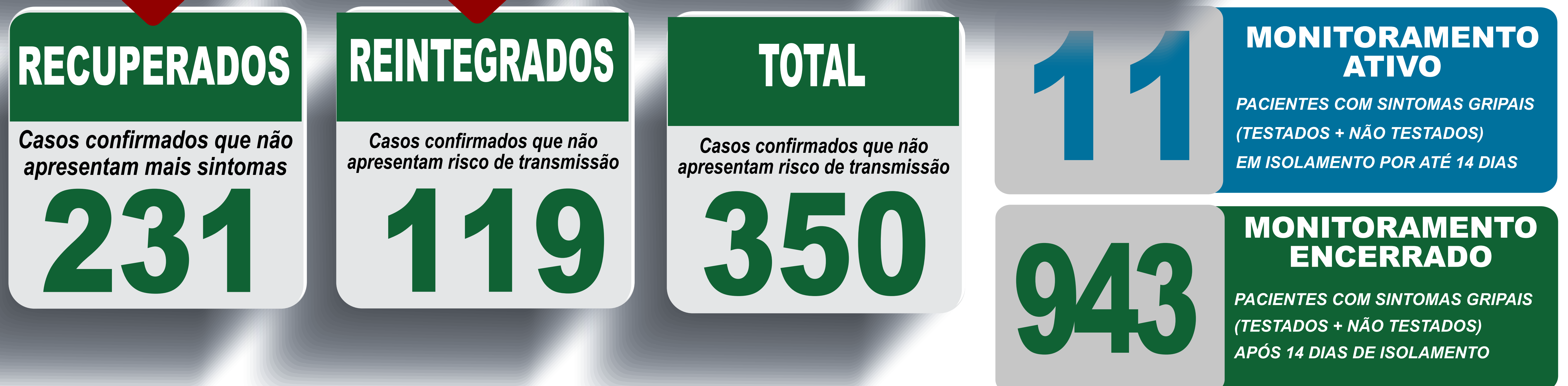
PLANILHA DE CASOS DE COVID-19 POR LOCAL DE RESIDÊNCIA, JABOTICATUBAS/MG