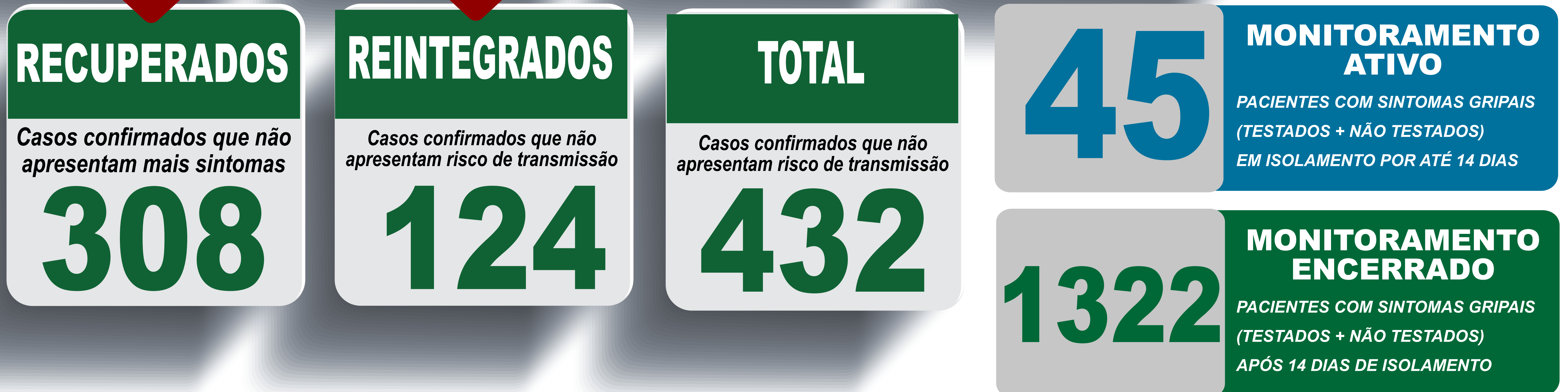
PLANILHA DE CASOS DE COVID-19 POR LOCAL DE RESIDÊNCIA, JABOTICATUBAS/MG